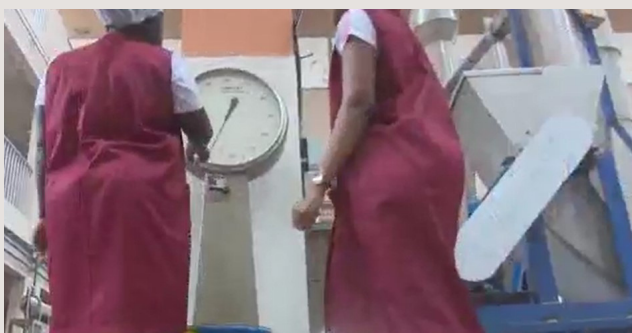
5. Pesage et transformation