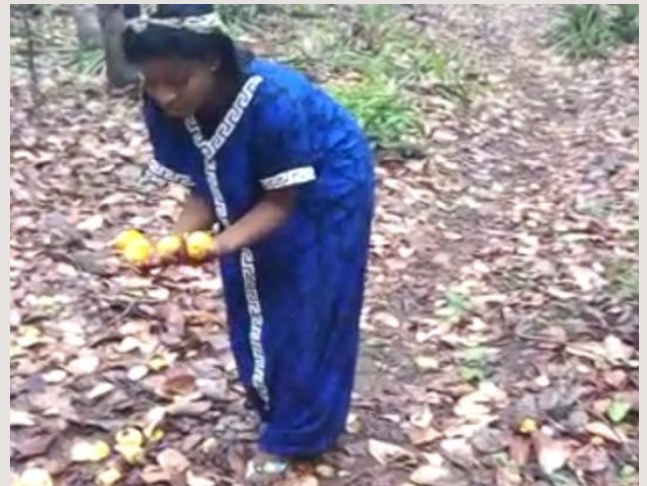
2. Ramassage des pommes (champ à Bondoukou)