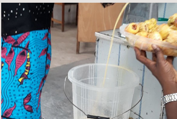
5. Extraction du jus après lavage