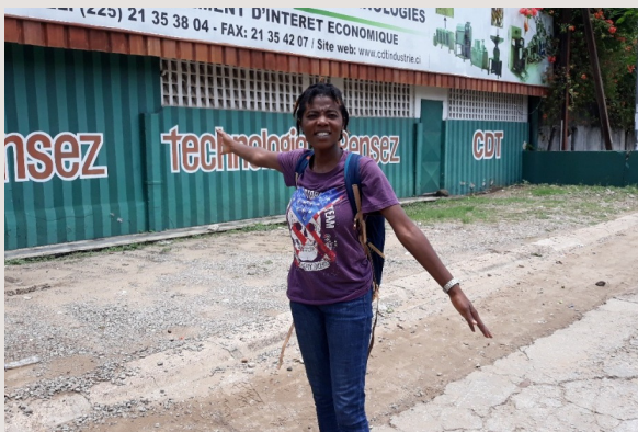
3. Arrivée au CDT (Abidjan)