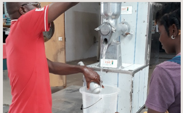
4. Préparation de la machine