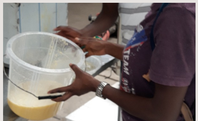
6. Exposition du jus en vrac