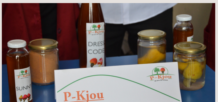
6. Stand d'exposition des produits