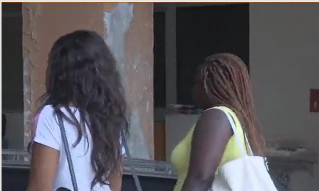
1. Arrivée à Yamoussoukro

L'entreprise P-KJOU, composée de Ida (admise à ESCPAU BUSINESS SCHOOL) et Judicaelle ont mené plusieurs démarches, dont une expérimentation au Laboratoire de l'INP-HB de Yamoussoukro) : suivons-les en images !